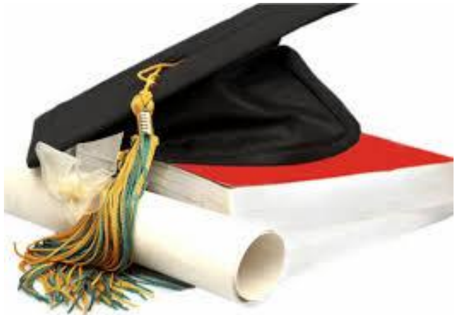
Integrált Tudományok Szakkollégiuma