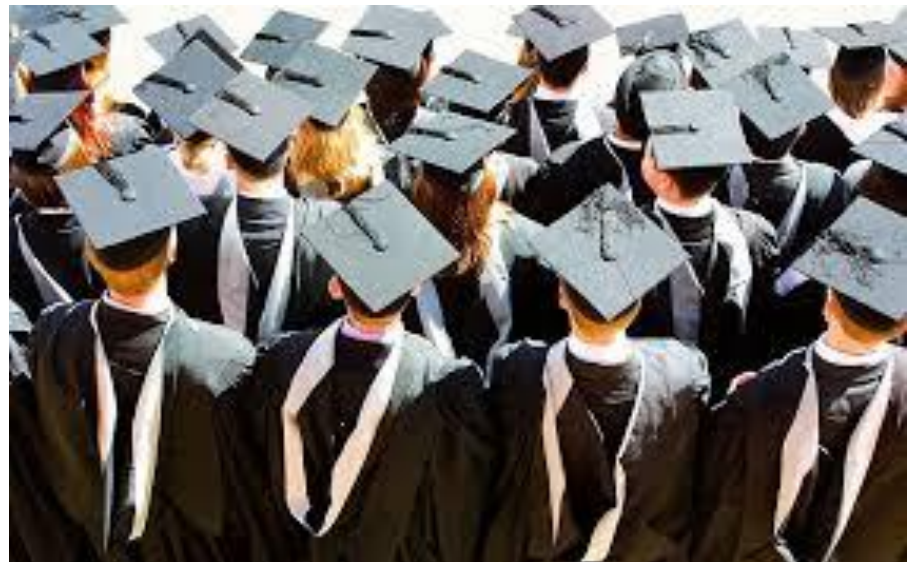
Integrált Tudományok Szakkollégiuma